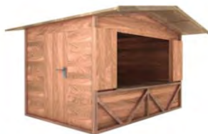
ALMHÜTTE TIROL 3 x 2 m Giebeldach