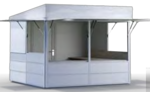
CITYSTAND weiß 3 x 3 m Pulldach