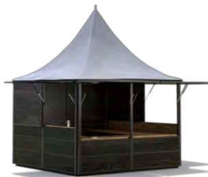
HÜTTENPAGODE 3 x 3 m Spitzdach