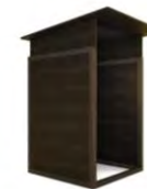
MARONIHÜTTE 1,5 x 1,5 m Pulldach