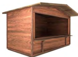
ALMHÜTTE SALZBURG 3,5 x 2 m Giebeldach