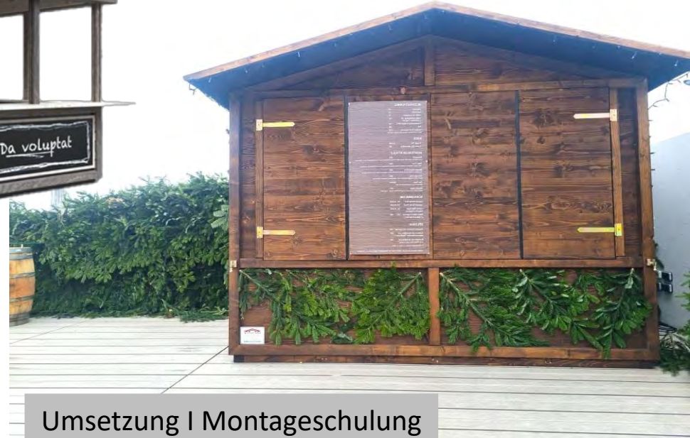
Umsetzung | Montageschulung

Natürlich bieten wir auch immer wieder GEBRAUCHTHÜTTEN oder KOMMISSIONSWARE an! Informationen dazu finden Sie auf unserer Homepage www.huette.at