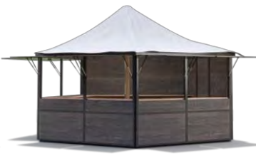
PAVILLON braun 5-Eck / d=5,4 m Spitzdach