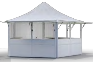
PAVILLON weiß 5-Eck / d=5,4 m Spitzdach