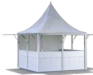
WEISSE HÜTTE 3 x 3 m Spitzdach