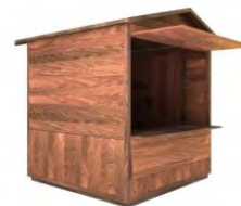
GIEBELDACHHÜTTE 2 x 2 m Giebeldach