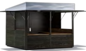
CITYSTAND 3 x 3 m Pulldach