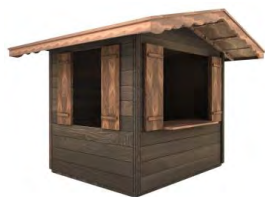
ALMHÜTTE RUSTIKAL 2,4 x 2 m Giebeldach