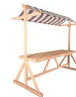
INDOORSTAND 2 x 1 m Stoffdach